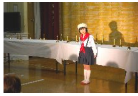
1年生はじめのあいさつ

が出ていない所でも、物の準備で忙しくてとても疲れたけど楽しく楽しくできたし、お客さんにたくさん笑ってもらえたのでうれしかったです。