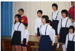
6年生おわりのあいさつ

○学習発表会は一人でいろいろな役割を持ちながら児童さんたちが楽しそうに演じておられたのがとても印象的で、心あたたまる思いで観させていただきました。太巻き作りは初めての体験でしたが、子どもたちと地域の方が一緒に取り組む一体感を感じさせていただきました。とてもおいしく楽しかったです。