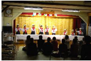
ミュージックベル