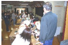
ジャンボ巻き寿司