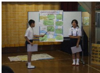
下府川探険の発表