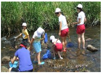
下府川の水生物調査

★下府川調査をした。下府川には、少しきかない水に住む生き物ときれいな水に住む生き物がいた。 ★下府川をきれいにして生き物がたくさんいる川にしたい。 ★下府川の水は、きれいだと思っていたけれど、あまりきれいじゃなかったのがっかりした。川によれた物を流さないようにしたい。